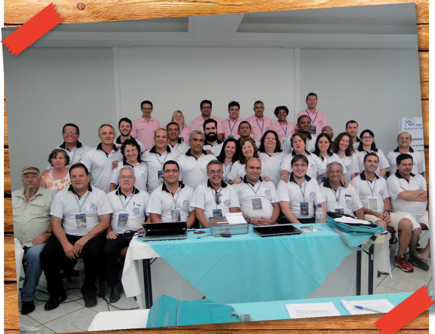
Delegados e convidados no X Congresso dos Trabalhadores da Unesp