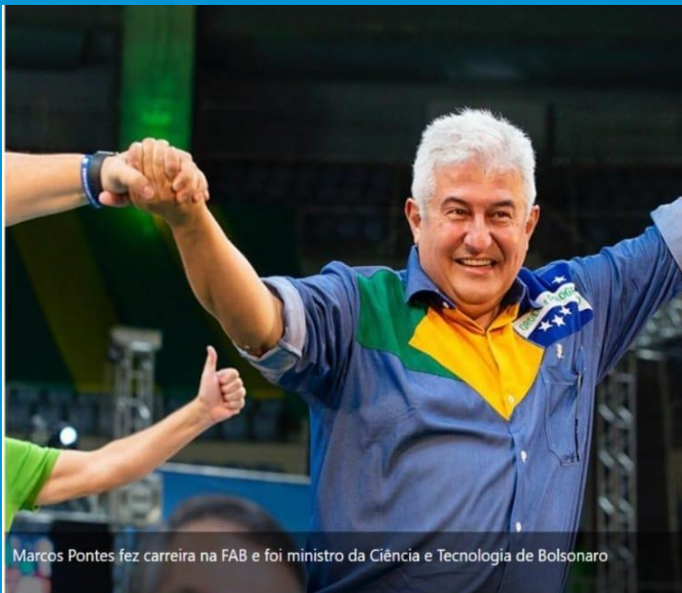
Marcos Pontes fez carreira na FAB e foi ministro da Ciência e Tecnologia de Bolsonaro

O Astronauta Marcos Pontes (PL) foi eleito senador pelo estado de São Paulo. Com 91,07% dos votos apurados, ele tem 49,91% dos votos, equivalente a 9.901.895 votos