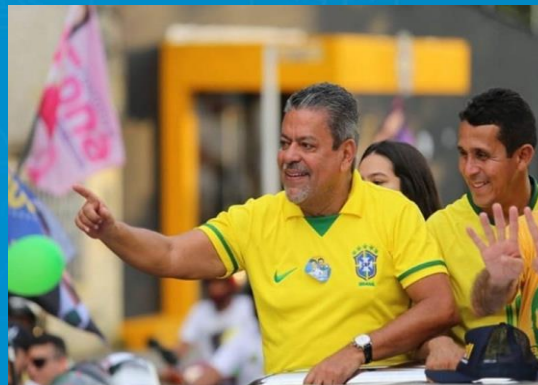
campanha ao Senado em Boa Vista

O Astronauta Marcos Pontes (PL) foi eleito senador pelo estado de São Paulo. Com 91,07% dos votos apurados, ele tem 49,91% dos votos, equivalente a 9.901.895 votos