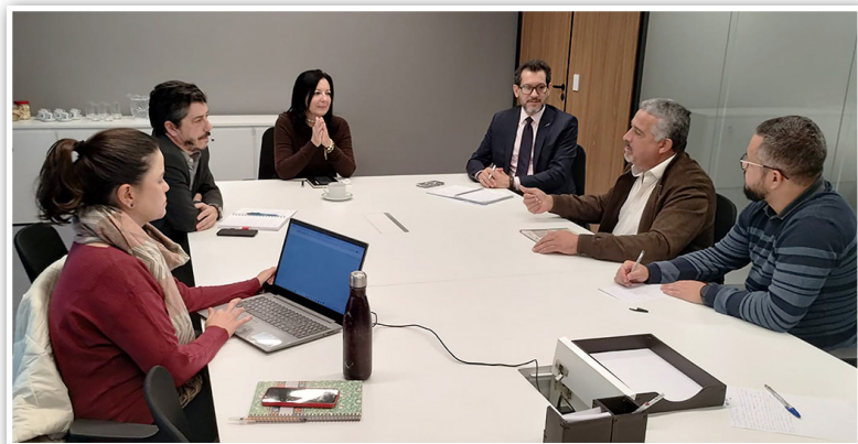
A reunião entre Sintunesp e reitoria, em 23/6/2026

A expectativa da entidade é que, após o protocolo da Pauta Específica, que está sendo construída nas assembleias de base, seja estabelecida uma agenda efetiva de negociações.