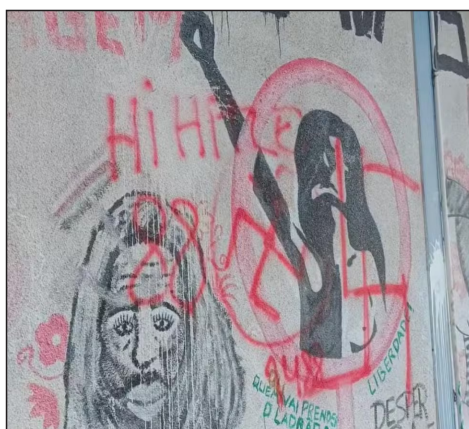
À esquerda, pichação em Marília. Ao lado, na parede do Diretório Acadêmico 3 de Maio, em Prudente