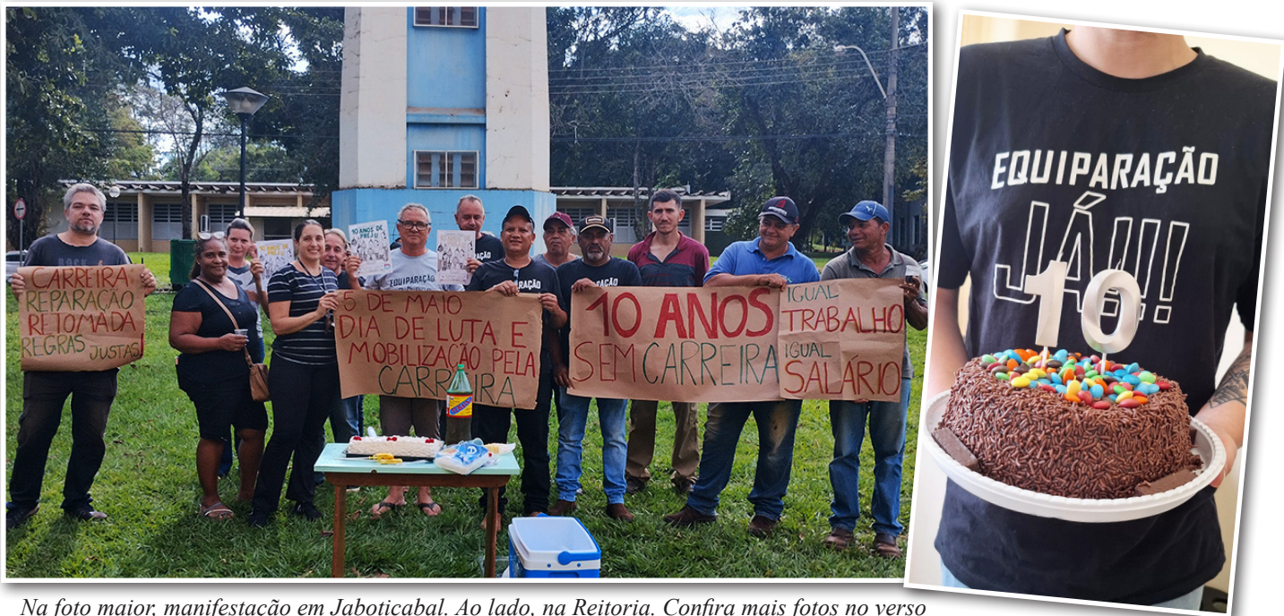
Na foto maior, manifestação em Jaboticabal. Ao lado, na Reitoria. Confira mais fotos no verso