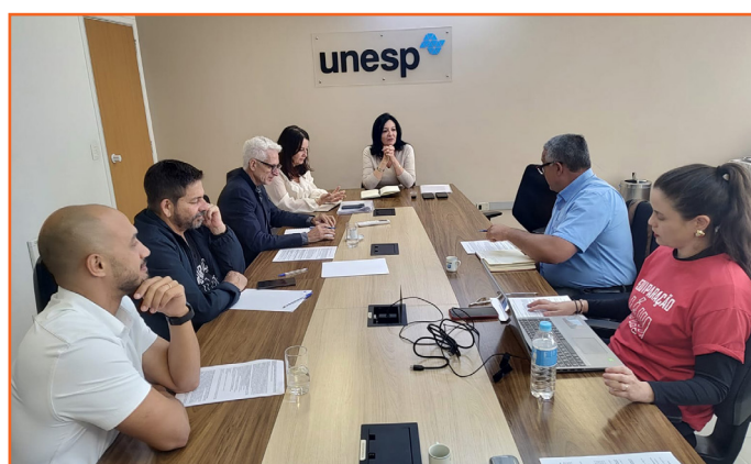
A negociação, em 22/10

Seguiram-se várias falas dos diretores do Sintunesp, reafirmando a enorme expectativa da categoria de que o compromisso da referência seja cumprido, para que não se confirme a sensação de que os direitos dos servidores técnico-administrativos são sempre os primeiros a serem questionados e que raramente se fala em cortes de outros investimentos. Eles lembraram que os R$ 6 milhões previstos para a promoção na carreira (GDPC) não serão utilizados esse ano, já