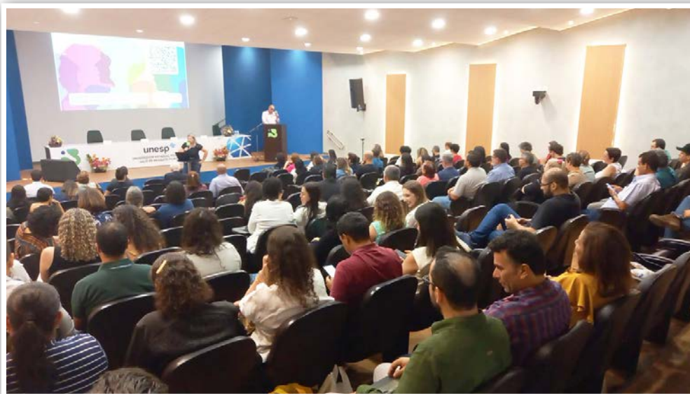
O evento teve palestras, mostras das seções técnicas de saúde, discussão em grupos e plenária final