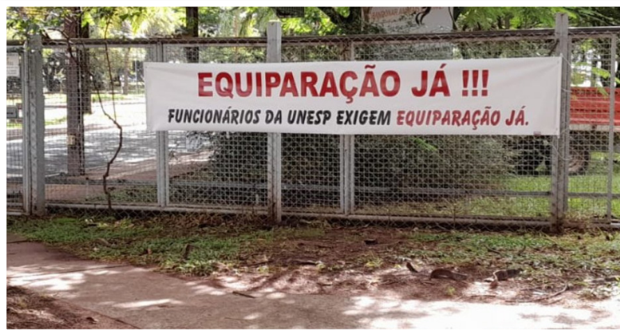
Faixa no campus de São José do Rio Preto

Ocorre que uma parte desta desoneração acabou retornando aos cofres paulistas, por compensação do governo federal, mas os 9,57% relativos às universidades (que incidem sobre a quota-parte do estado-QPE, que é de 75% do total arrecadado) não foram repassados. A estimativa do Fórum das Seis é que as universidades deixaram de receber cerca de R$ 644 milhões entre agosto/2022 e janeiro/2023. O Fórum enviou ofício ao então governador Rodrigo Garcia, em dezembro passado, e agora ao atual governador, Tarcísio de Freitas, solicitando o