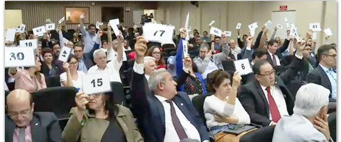
CO em 26/4/2023: Momento da votação da proposta que garantiu isonomia aos técnico-administrativos em relação ao procedimento usual com o segmento docente: apresentação de documentos e pagamento em fluxo contínuo, sem interstício

Nas sessões do CADE (21/6) e do CO (29/6), representantes do Chapão Sintunesp/Associações cobraram a correção desta irregularidade, inclusive apontando exatamente as falas e votações do tema