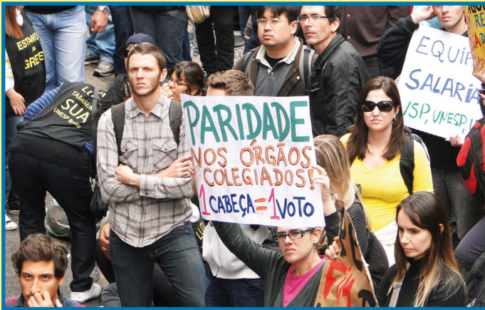
Mobilização em 2013: junto com as reivindicações salariais, a luta pela paridade (peso igual para os três segmentos) nos colegiados da Universidade