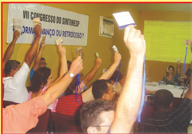
Na foto do alto, Sintunesp presente em ato conjunto das universidades, em SP, em 2004. Na foto mais acima, congresso da entidade no mesmo ano