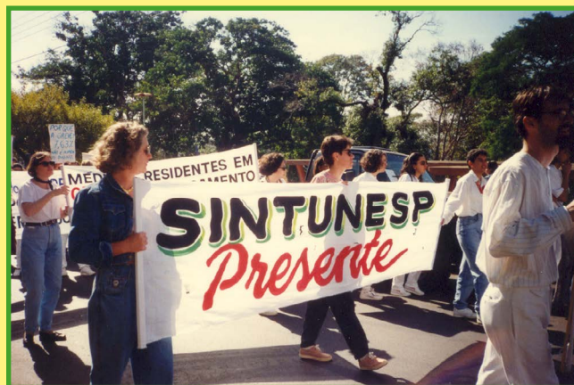
Dois momentos na greve de 1996: À esquerda, servidores da reitoria em ato realizado na Assembleia Legislativa, unificando a luta por reajuste com a reivindicação de mais recursos para a universidade na LDO. À direita, passeata em Botucatu