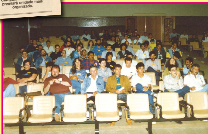
O Congresso de fundação do Sintunesp, em setembro de 1989, no campus de Jaboticabal. Acima, o primeiro jornal da entidade