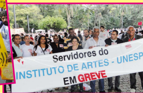
A forte greve de 2014, que forçou os reitores a saírem do zero e concederem reajuste. Adesão forte em todos os campi