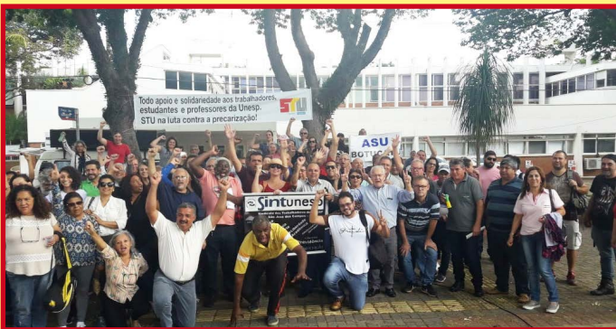
2/6/2019: Ato do Fórum das Seis na Unicamp, em apoio à isonomia de reajustes para o pessoal da Unesp