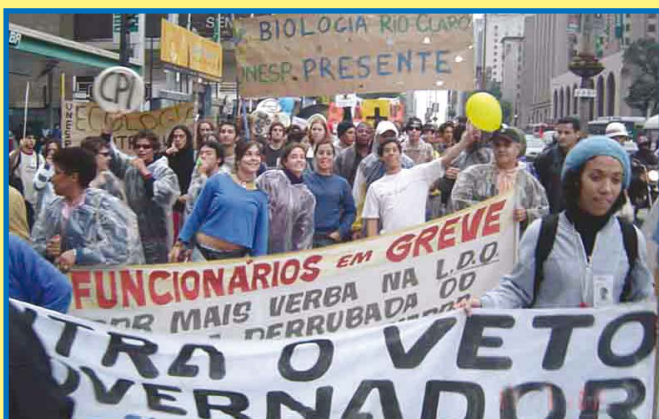
Em 2005, passeata na Av. Paulista, em SP, contra o veto do governador ao aumento das verbas para as universidades, que havia sido aprovado na Alesp