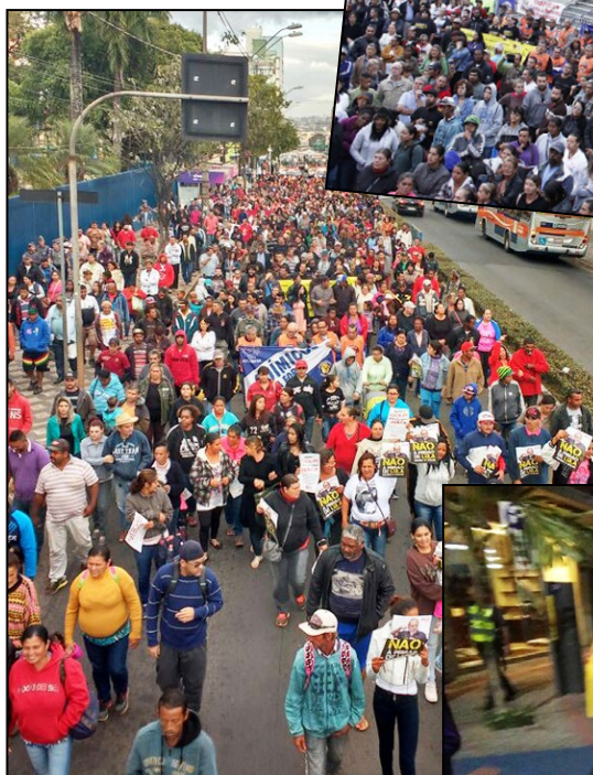
Acima e à esquerda, Bauru. Logo abaixo, Botucatu. Nas fotos do rodapé, Jaboticabal (esq.) e Rio Preto